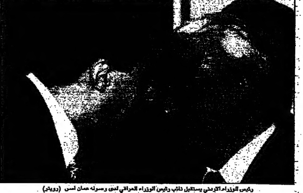
وزير الخارجية الاماراتي يستقبل نائب وزير العراق الذي وصله صمان اسد (رويات)

بغداد - من ايون برخو: وصلت مجموعة من مواطني الامارات العربية للحددة الى بغداد امس لتسلم 32 طناً من حليب الاطفال الحفظ والايوية كسادة لخبص العراق التي اضرته به العقوبات الدولية.